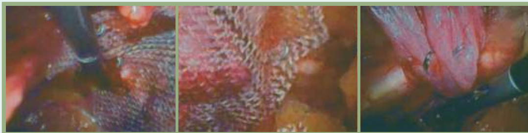
Pictures of SPIRE'IT® sutures implanted on during TEP procedure for direct bilateral inguinal hernia repair in mesh fixation and tissues approximation.

Images de sutures SPIRE'IT® implantées pour la fixation d'implant et de tissus dans une cure de hernie inguinale directe bilatérale par voie TEP.